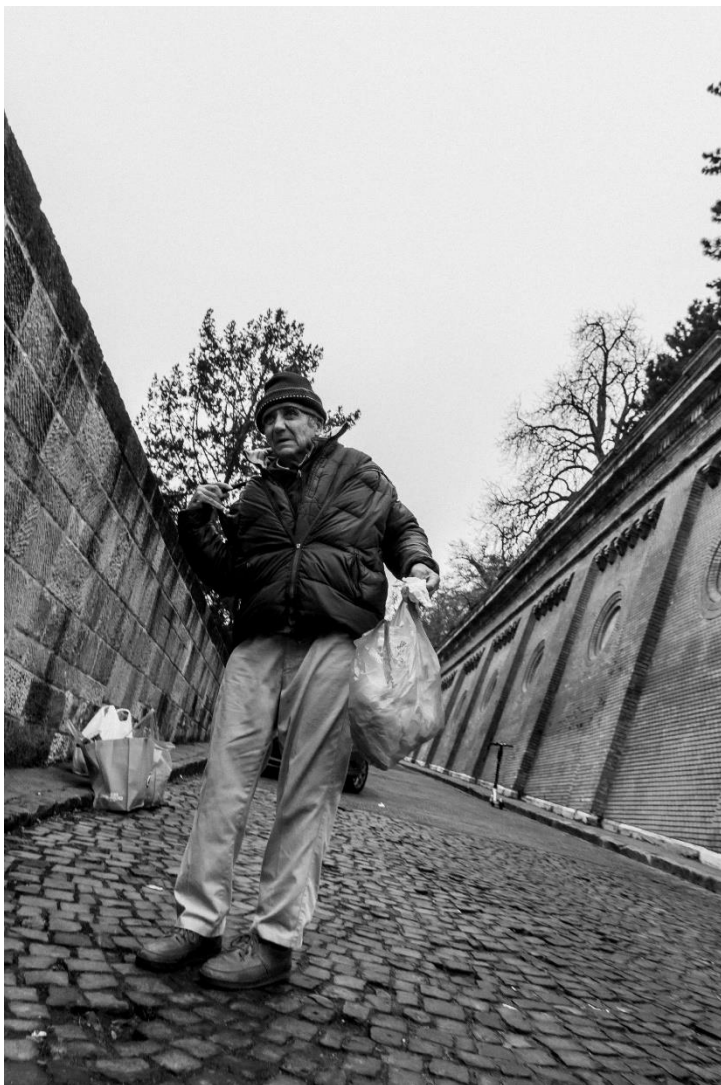
slika 17: Ulica, serija Budimpešta, 2019