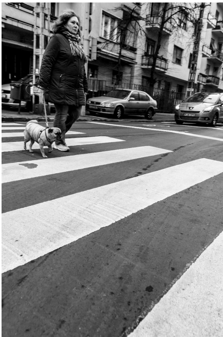
slika 18: Ulica, serija Budimpešta, 2019