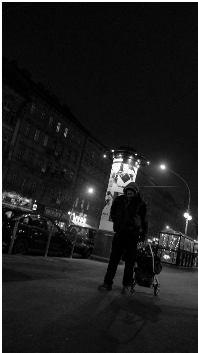
slika 8: Ulica, serija Budimpešta, 2019