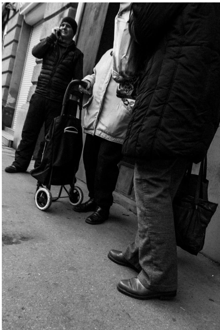
slika 1: Ulica, serija Budimpešta, 2019