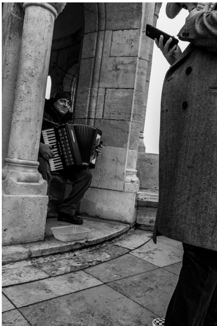
slika 10: Ulica, serija Budimpešta, 2019