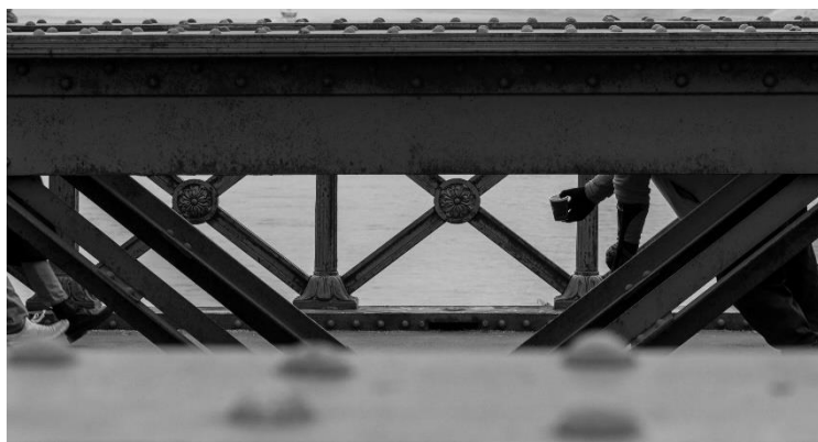
slika 14: Ulica, serija Budimpešta, 2019