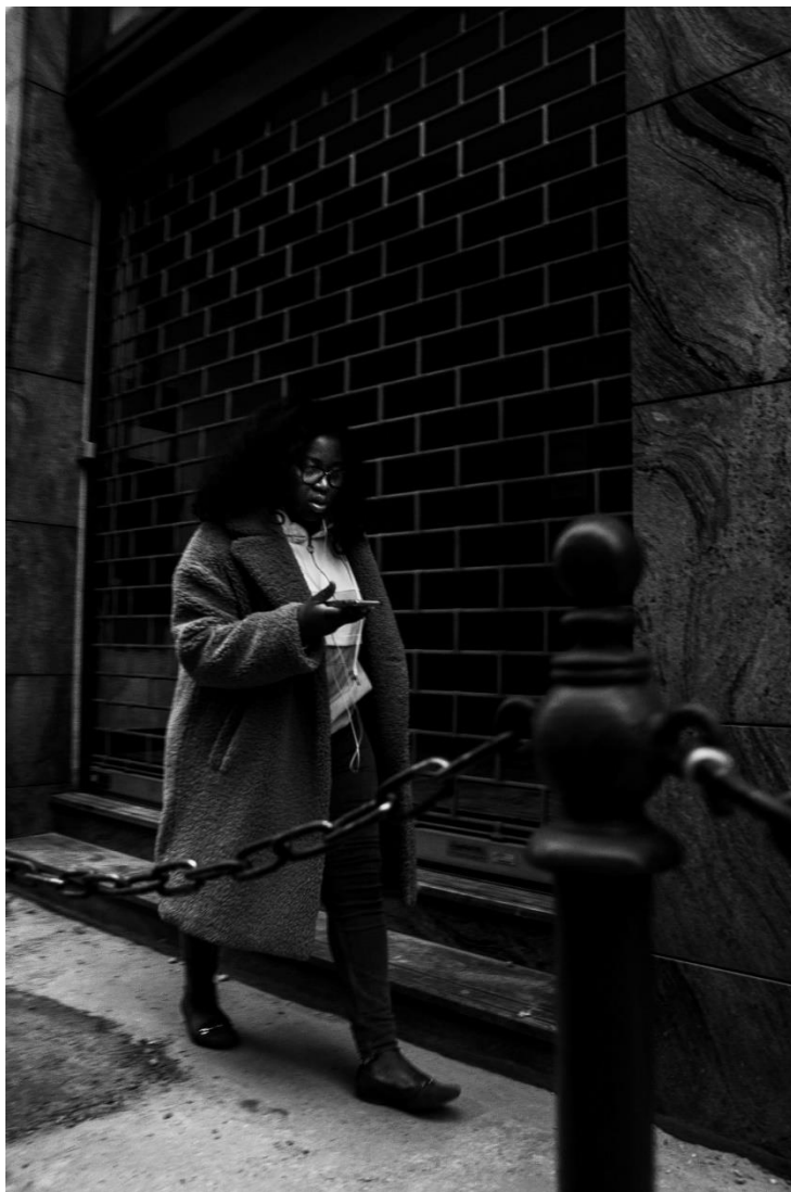
slika 4: Ulica, serija Budimpešta, 2019