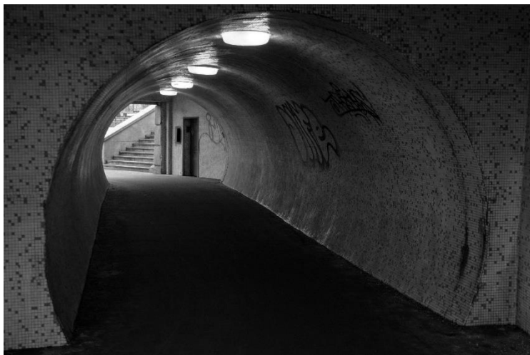
slika 7: Ulica, serija Budimpešta, 2019