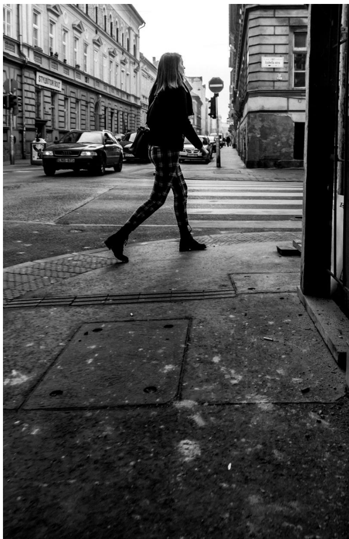
slika 2: Ulica, serija Budimpešta, 2019