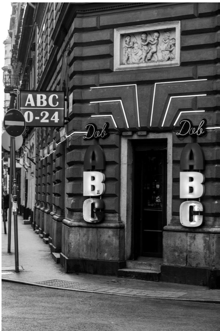
slika 3: Ulica, serija Budimpešta, 2019