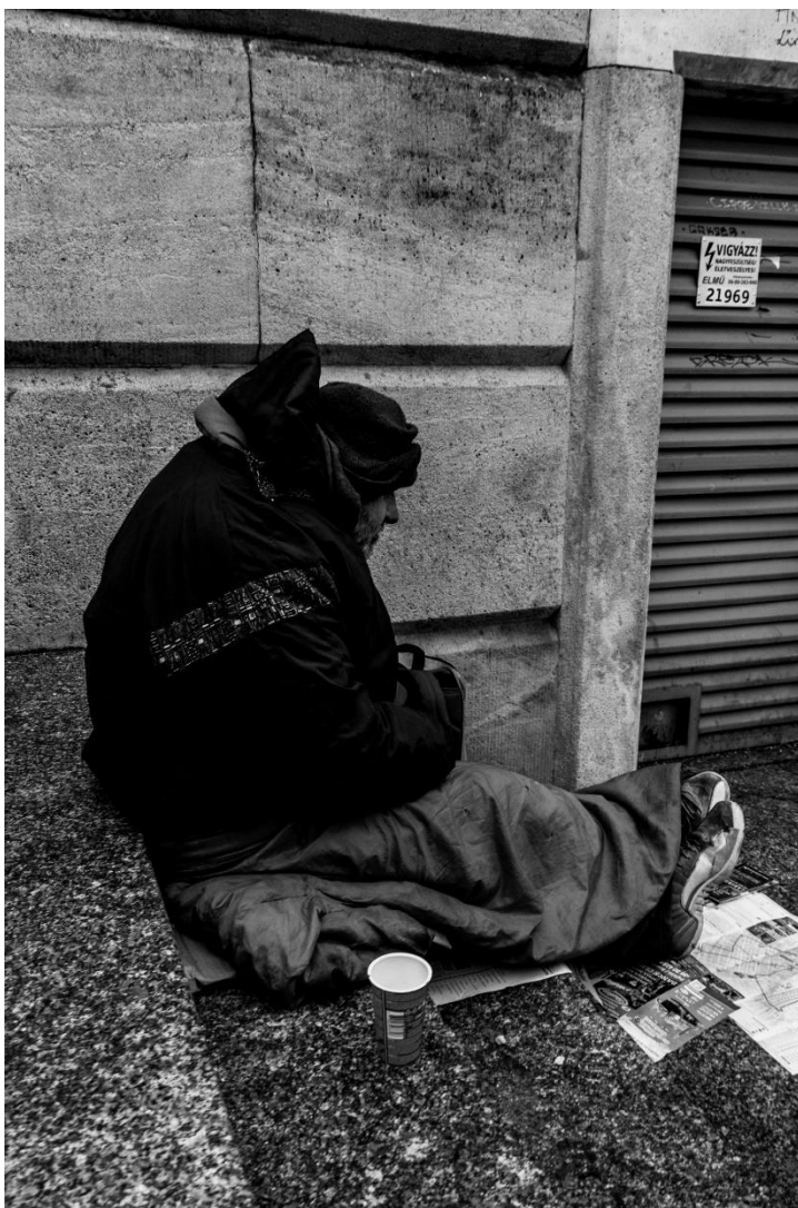
slika 5: Ulica, serija Budimpešta, 2019