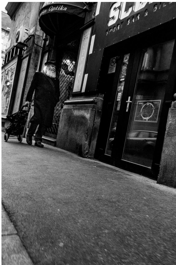
slika 16: Ulica, serija Budimpešta, 2019