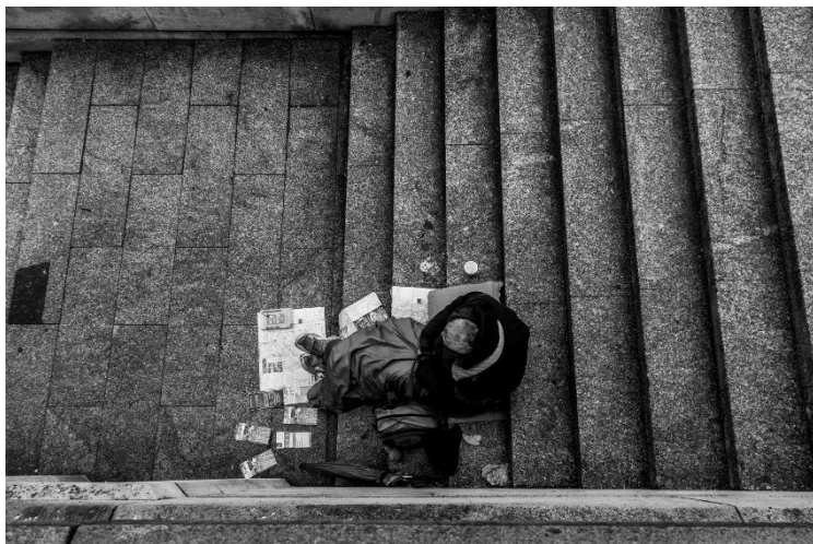
slika 13:Ulica, serija Budimpešta, 2019