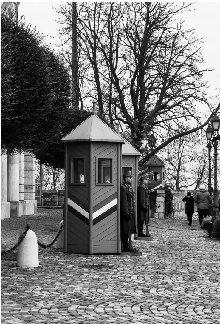
slika 6: Ulica, serija Budimpešta, 2019