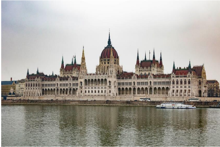
slika 15: Ulica, serija Budimpešta, 2019