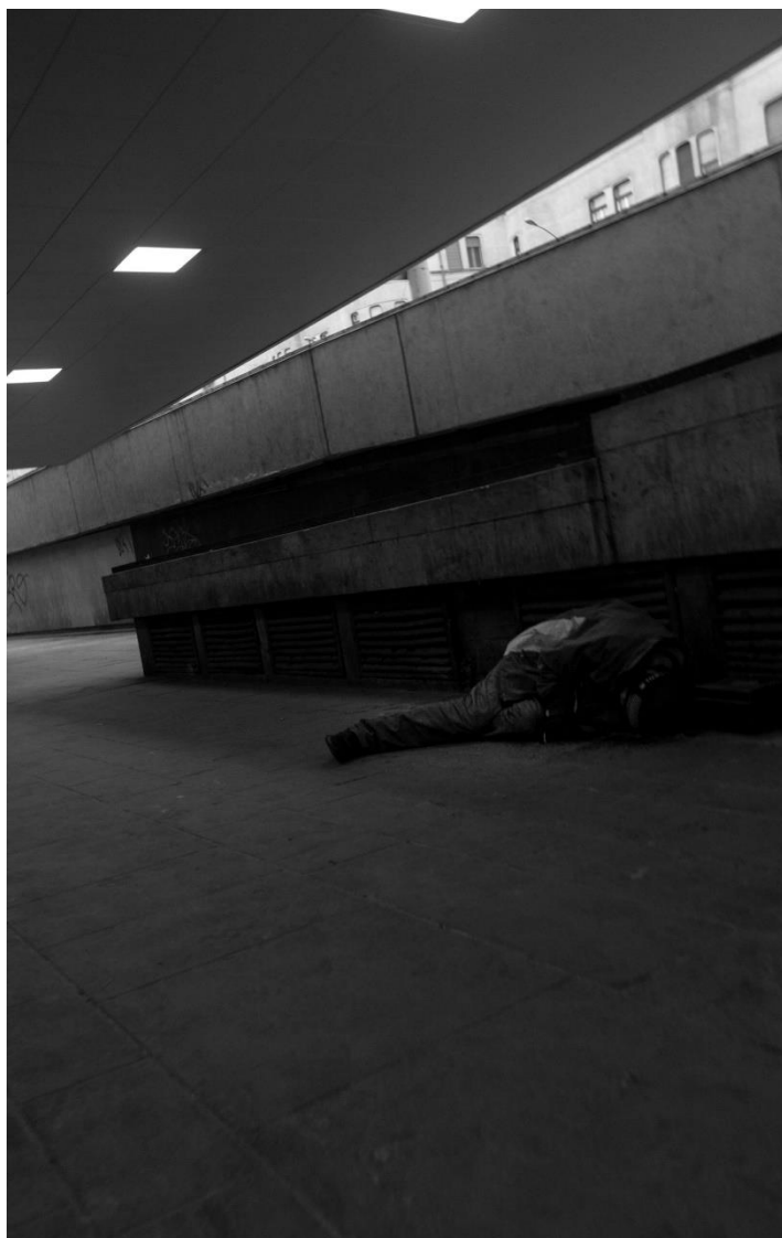
slika 12: Ulica, serija Budimpešta, 2019