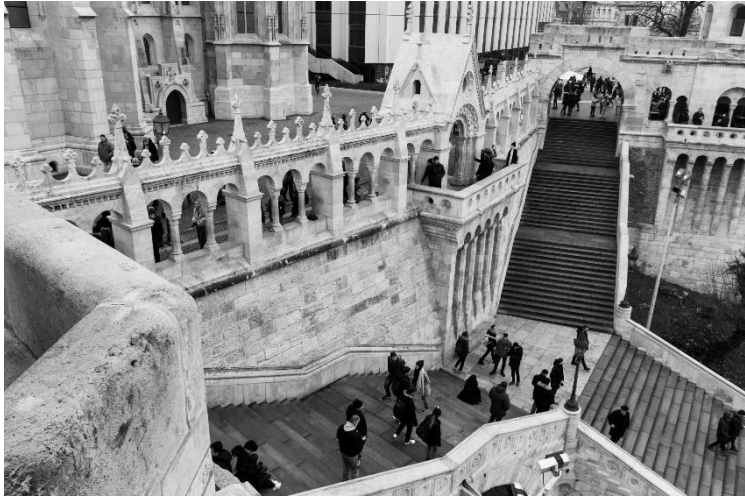
slika 9: Ulica, serija Budimpešta, 2019