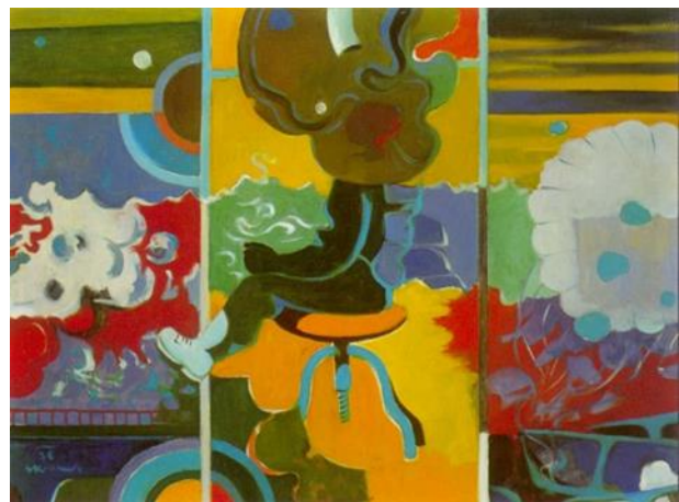
Deček pod oblakom, 1970