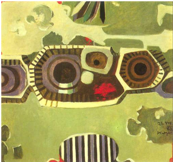
21. avgust 1968 (Vdor sovjetskih čet), 1968