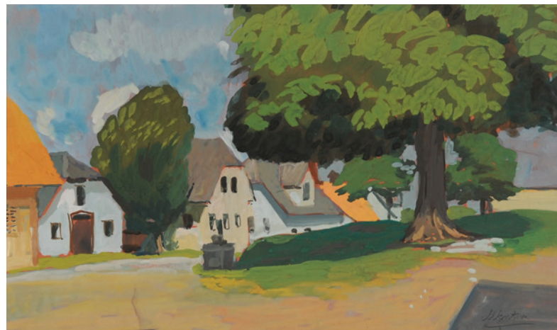
Morava, ni dat., sign. d. sp.: M. Butina, gvaš / papir, 19,5 x 33 cm

Odprtje razstave v četrtek, 14. 9. 2023, ob 18. uri.